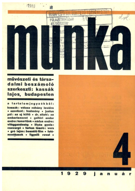
A Munka folyóirat 1929. januári száma a Budapesti Királyi Büntetőtörvényszék pecsétjével (magángyűjteményben).